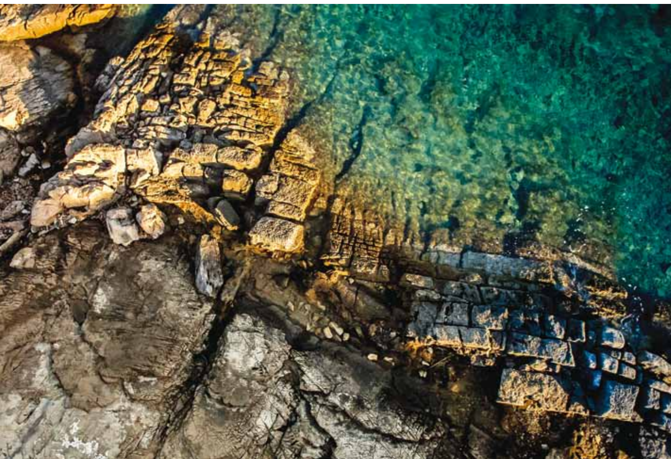
Rozeklaná skaliska a tyrkysově modrá voda jsou vůbec pro Chorvatsko velmi typické. Kolmý pohled dolů se mi pro tento typ struktur jevil pak jako nejlepší. 1/4000 s, f/3,5, ISO 400