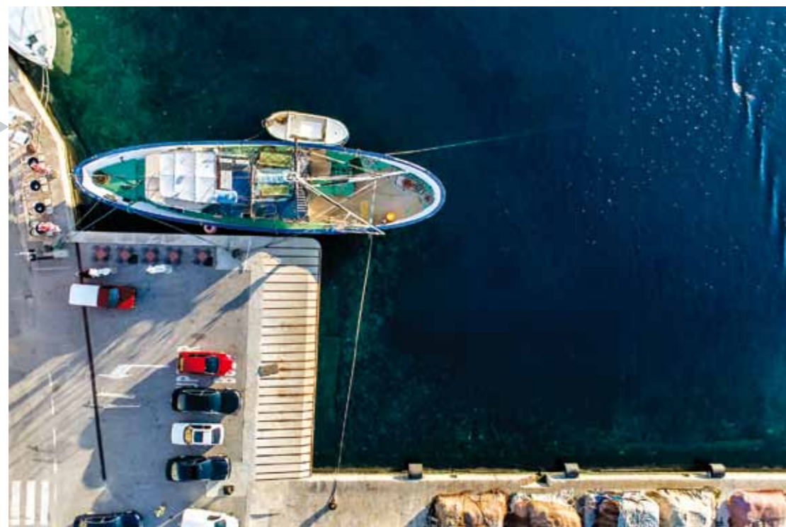
Rybářská loď za časného rána. Vrtulník jsem musel nad středem lodi držet hodně dlouho, aby alespoň na jednom snímku vyšla kompozice, s jakou bych byl spokojený. 1/4000 s, f/2,8, ISO 800

tulník? Když jej vidí „profesionální“ modeláři, jen se smějí. Je totiž velmi jednoduchý, bez pokročilé elektroniky. Když víte, co a jak, dokážete ho postavit za zlomek peněz, než co investovali oni do mnohem složitějších strojů. Máme zde tedy kombinaci ultralevného fotoaparátu s ultralevným vrtulníkem (přesnou hodnotu neumím vyčíslit, bude se pohybovat patrně max. kolem dvaceti tisíc korun). Mohou z takové kombinace