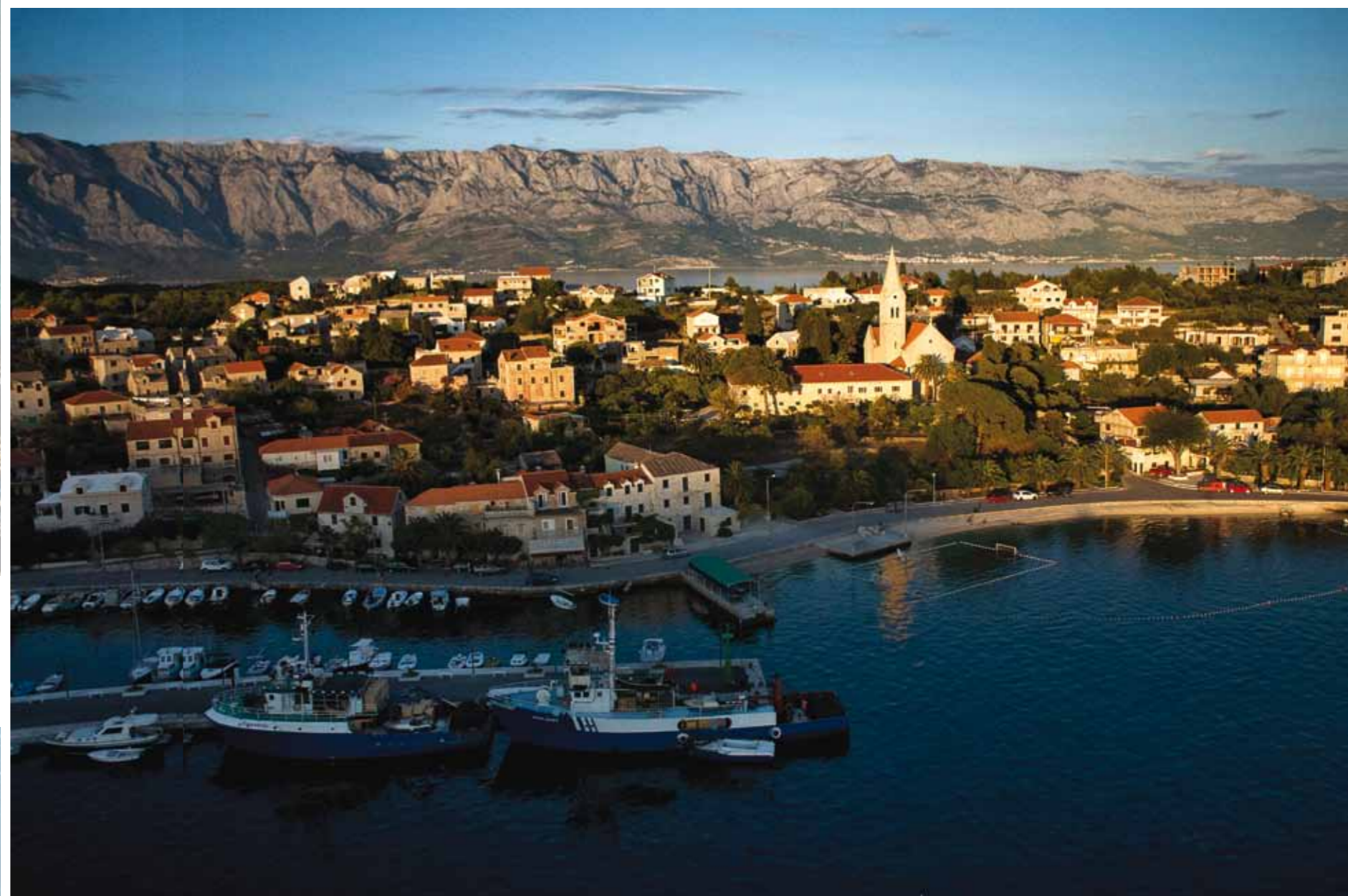
Přístav Sumartin z výšky zhruba 50 metrů. V dále je krásně vidět pohoří Biokovo, které se klene do nadmořské výšky více jak kilometru a půl přímo od moře. 1/4000 s, f/2,8, ISO 400

Ano, technika je osvobozující. Už jsem si za ty roky zvykl na profesionální stroje, ale přesto jsem byl nucen udělat – byť třeba jen na chvíli – krok zpět. Na svůj rádiem řízený vrtulník nemohu pověsit velkou zrcadlovku, ba ani malou. Váhové omezení je nemilosrdné a já si, věrný značce, zakoupil svůj první kompak – Nikon 1 J1. Z druhé ruky vyšel i s objektivem 10/2,8 na 4 500 korun, i můj polarizák na zrcadlovku byl dražší. A ten vr-