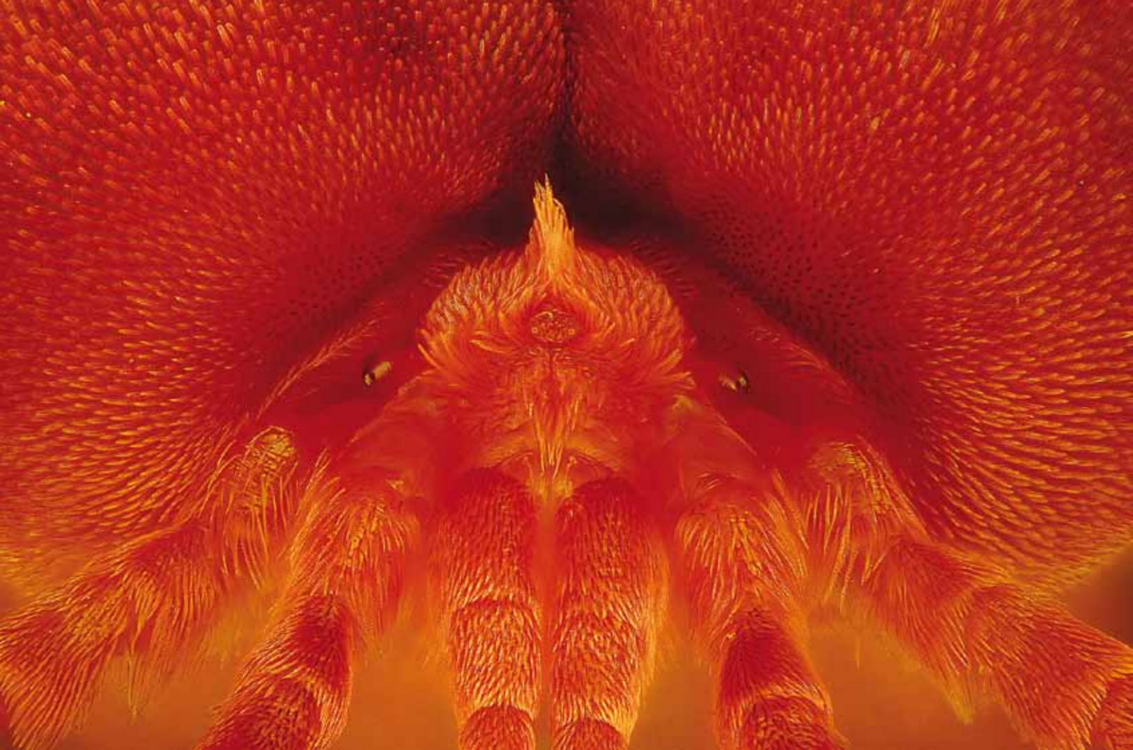
Sametka rudá ( Trombidium holosericeum ), Chomutov (ČR), 27. dubna 2013 Canon EOS 5D mark II, Canon 200/2,8 L USM + Nikon MPlan 10x, clona 2,8, expoziční čas 1/200 s, ISO 200, osvětlení LED lampami, fotografie složená z 65 fotografií