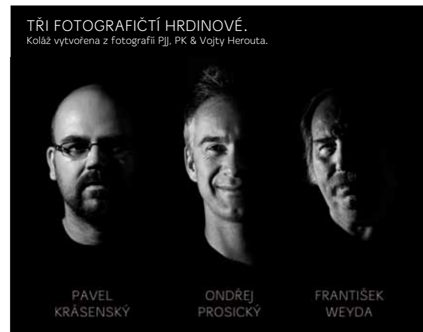
TŘI FOTOGRAFIČTÍ HRDINOVÉ.