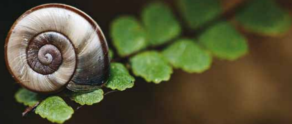
Vojtěch Duchoslav, Skalnatka