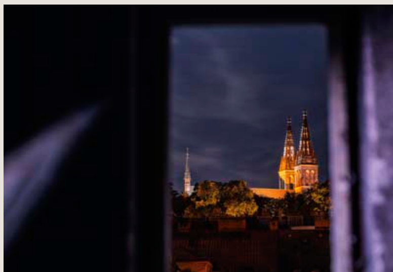
Z budovy nádraží je přímo vidět na národní kulturní památku, která mu dala jméno – Vyšehrad.

prozatím měl tu čest fotografovat, jsem si obvykle plnými doušky užíval samoty, ticha probouzející se přírody či hluboké tmy ve skalách. Opuštěné a značně chátrající nádraží pražského Vyšehradu však takový klid nenabízí a rozhodně se neřadí mezi místa, kam bych někdy plánoval vyrazit sám, bez podpory přátel a kolegů – fotografů,“ vypráví Petr Jan Juračka. „Kromě, řekněme, méně přátelských obyvatel této kdysi nebývale krásné secesní budovy je možné potkat v neutěšených prostorách také potkany či divoké psy. Z různých koutů místností, kde kdysi proudily davy cestujících, se dnes line silný zápach odpadků, lidských i zvířecích výkalů. I přes tento hanebný stav, v jakém se budova nachází, však stále působí monumentálně – a kdo ví, třeba ji jednou někdo dokáže zachránit před zbořením a výstavbou nového nákupního centra,“ uzavírá svoje zážitky z fotografování Petr Jan Juračka. –TOMÁŠ TUREČEK